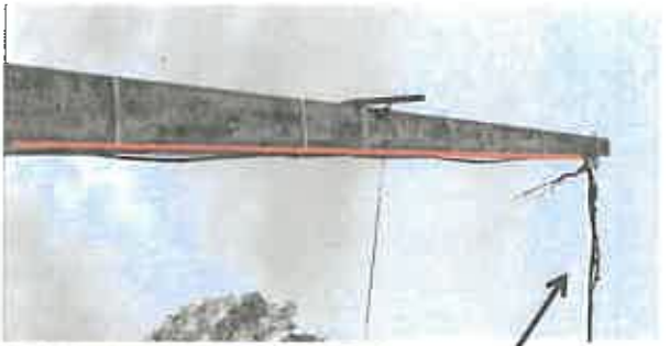
CONNEXION SUR T150 AL