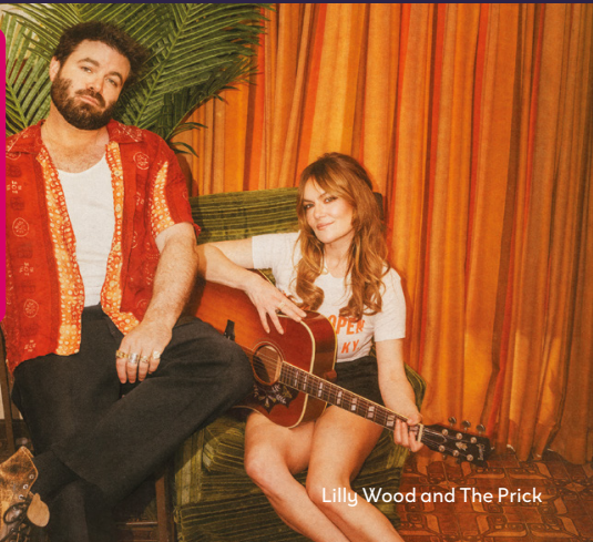
Lilly Wood and The Prick

Infos et réservations jardinsonorefestival.com