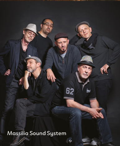
Massilia Sound System