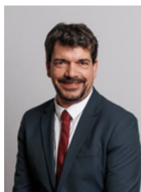
Loïc GACHON Maire de Vitrolles