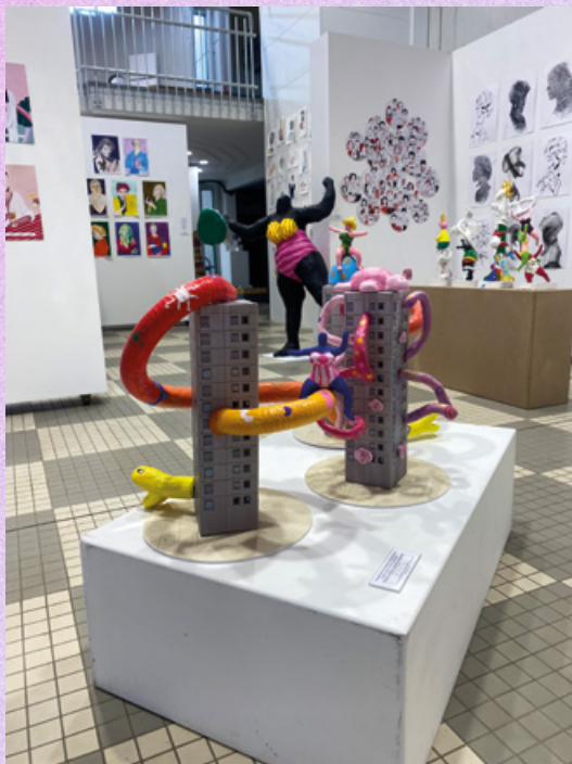
Photos prises lors des expositions de l'EMAP.