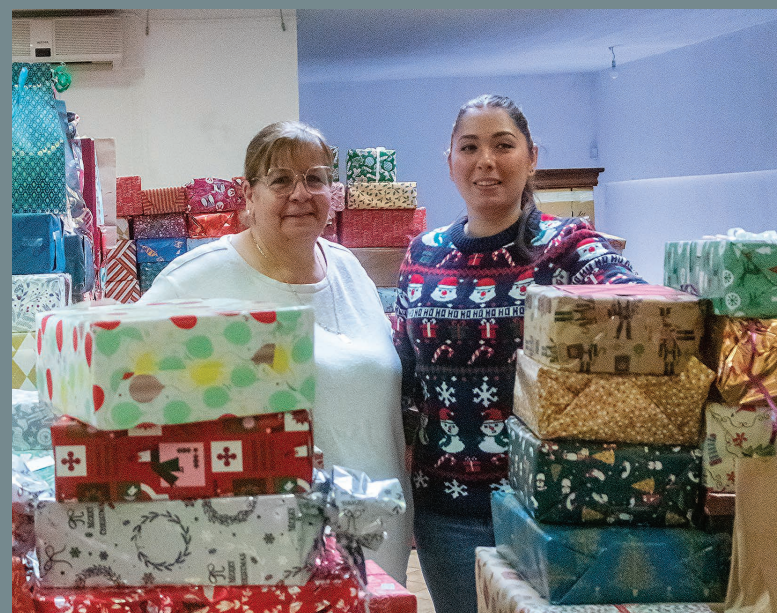
Les Vitrollais sont généreux ! 436 boîtes de Noël solidaires récoltées et distribuées aux personnes fragiles et isolées.