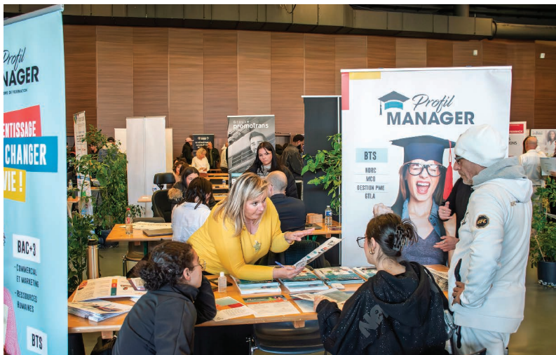
Plus de 400 entretiens ont eu lieu pendant le salon de la formation et de l'alternance 2025 permettant aux jeunes de trouver une formation ou une première expérience.

L'objectif est de permettre à chaque jeune de découvrir ses talents, d'élargir son horizon et de construire son avenir en toute confiance, entouré d'experts et de professionnels inspirants.