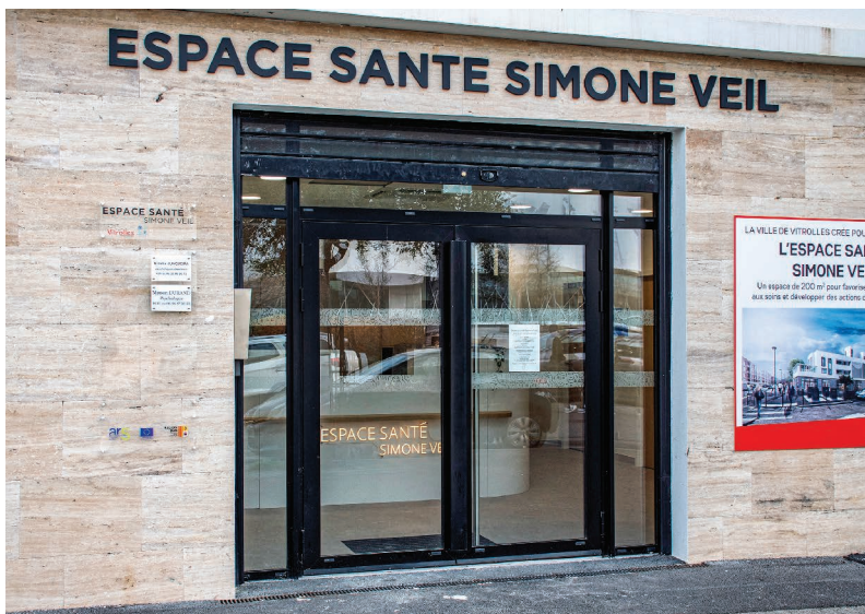
L'Espace de santé Simone Veil est un des sites de la MSP de la Pierre Plantée comprenant un réseau de 30 professionnels de santé.

Deux orthophonistes proposent des ateliers de langage pour les enfants de 2 à 3 ans. La protection maternelle et infantile (PMI)