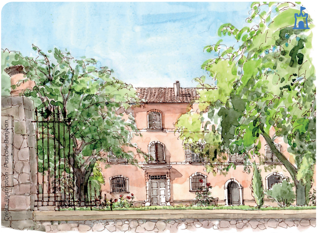
LA BASTIDE de MONTVALLON