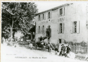
VITROLLES - Le Marché du Regras