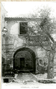
VITROLLES - Le Puits

A 300 ans de distance, comment les habitants de Vitrolles ont-ils vécu ces deux épisodes inédits qui ont marqué notre pays ?