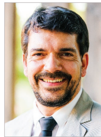
Loïc GACHON Maire de Vitrolles