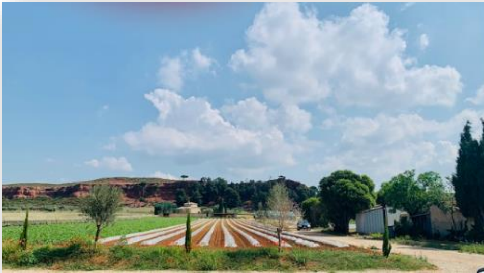
Zone Agricole Protégée

Afin d'accompagner ce mouvement vertueux et inverser la tendance liée aux réductions des exploitations, la Ville a récemment acquis un terrain agricole et souhaite y installer un agriculteur.