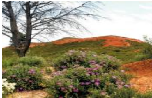
Plateau de Vitrolles